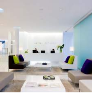
SIÈGE UNIBAIL RODAMCO, Paris 16