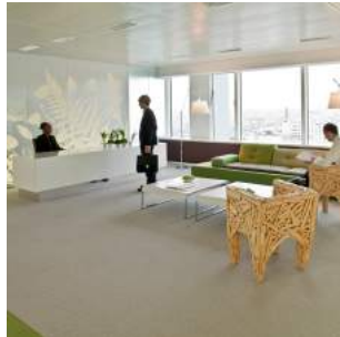
TOUR SO OUEST, Levallois-Perret