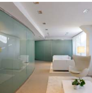
MEDICAPITAL BANK, Paris 1