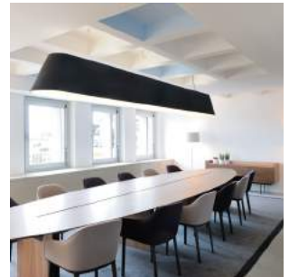
JC DECAUX, Neuilly sur Seine